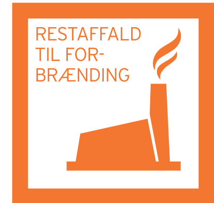
RESTAFFALD TIL FORBRÆNDING, fx: